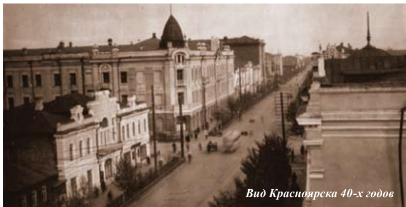
Вид Красноярска 40-х годов

Едва прозвучало заявление наркома иностранных дел СССР Вячеслава Молотова о нападении фашистской Германии, люди начали собираться на общие собрания. Уже в первой половине дня 23 июня в райвоенкоматы и райкомы партии поступили сотни заявлений о зачислении добровольцами в Красную Армию.