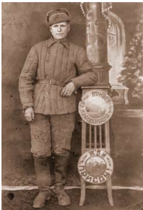
Боец 133 отдельного батальона связи перед отправкой на фронт, 1941 г.

В 1941 году из добровольцев были созданы три отдельных комсомольско-молодежных лыжных батальона. 15 августа и 22 сентября 1942 года из Красноярска от комсомольской организации края в распоряжение штаба партизанского движения Карельского фронта были отправлены две группы добровольцев из 46 и 55 человек. Но для того, чтобы победить врага, необходима была массовая мобилизация. В первый же день войны начался призыв военно-обязанных из запаса и допризывников, за годы войны были призваны граждане 1923-го, 1924-го,