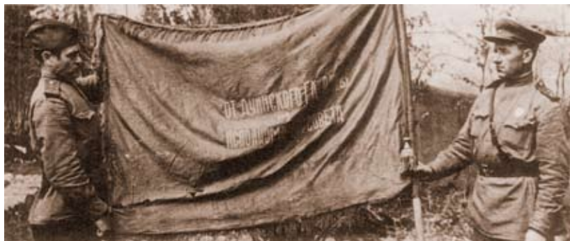
1941 г. Знамя Ачинского горкома ВКП(б), вручённое 378-й стрелковой дивизии перед отправкой на фронт

Отдельно нужно сказать о боевых действиях 365-го стрелкового полка этой дивизии. Когда началось немецкое наступление на Москву, полк был выведен из ее состава и направлен защищать столицу на ближних подступах. Заняв 7 октября оборону в нескольких километрах от Гжатска, у шоссе Москва – Минск, полк трое суток в рукопашных схватках стоял насмерть и тем самым дал возможность командарму Рокоссовскому со своим штабом выйти из окружения. За мужество и героизм 365-й полк